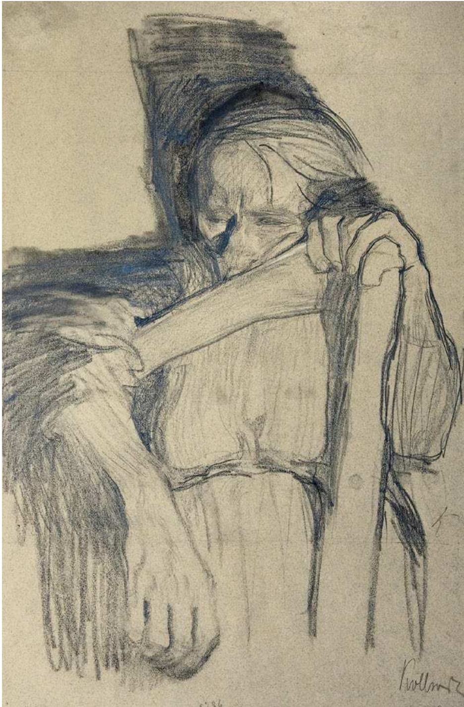
Käthe Kollwitz, Vorzeichnung zu »Beim Dengeln«, Blatt 3 aus dem Zyklus »Bauernkrieg«, 1905