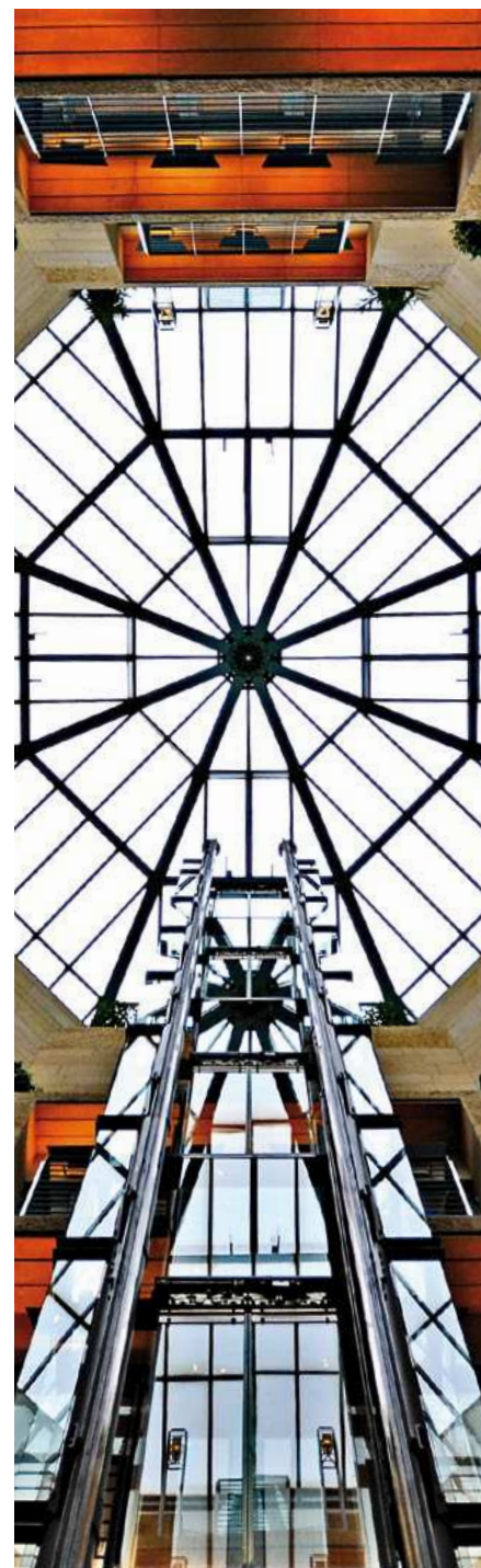
Aufzug zum Museum und Glaskuppel in der Neumarkt Passage

Hier kann der Besucher mit einem gläsernen Aufzug nach oben schweben, bis er – vorbei an den Räumen einer Buchhandlung – an einem Umgang auf der vierten Etage angekommen ist. Von dort sind es nur noch wenige Schritte bis zum Eingang des Museums.