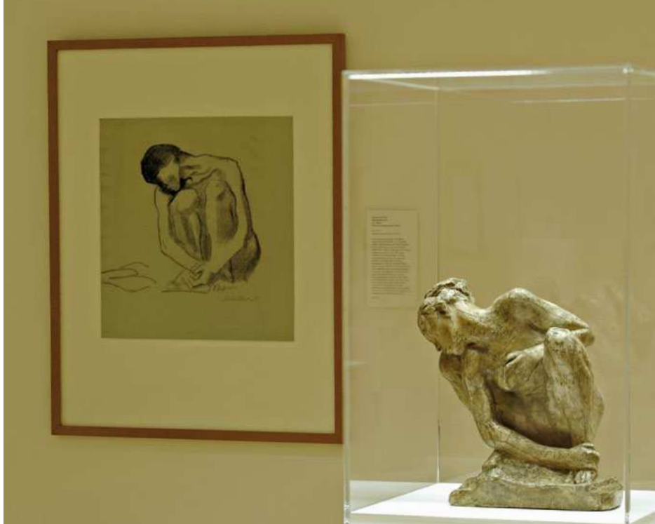
Oben: Käthe Kollwitz, Hockender weiblicher Akt , um 1904, Kohle auf grauem Bütten, und Auguste Rodin, Kauernde , 1881, patinierter Gips, Musée Rodin, Paris