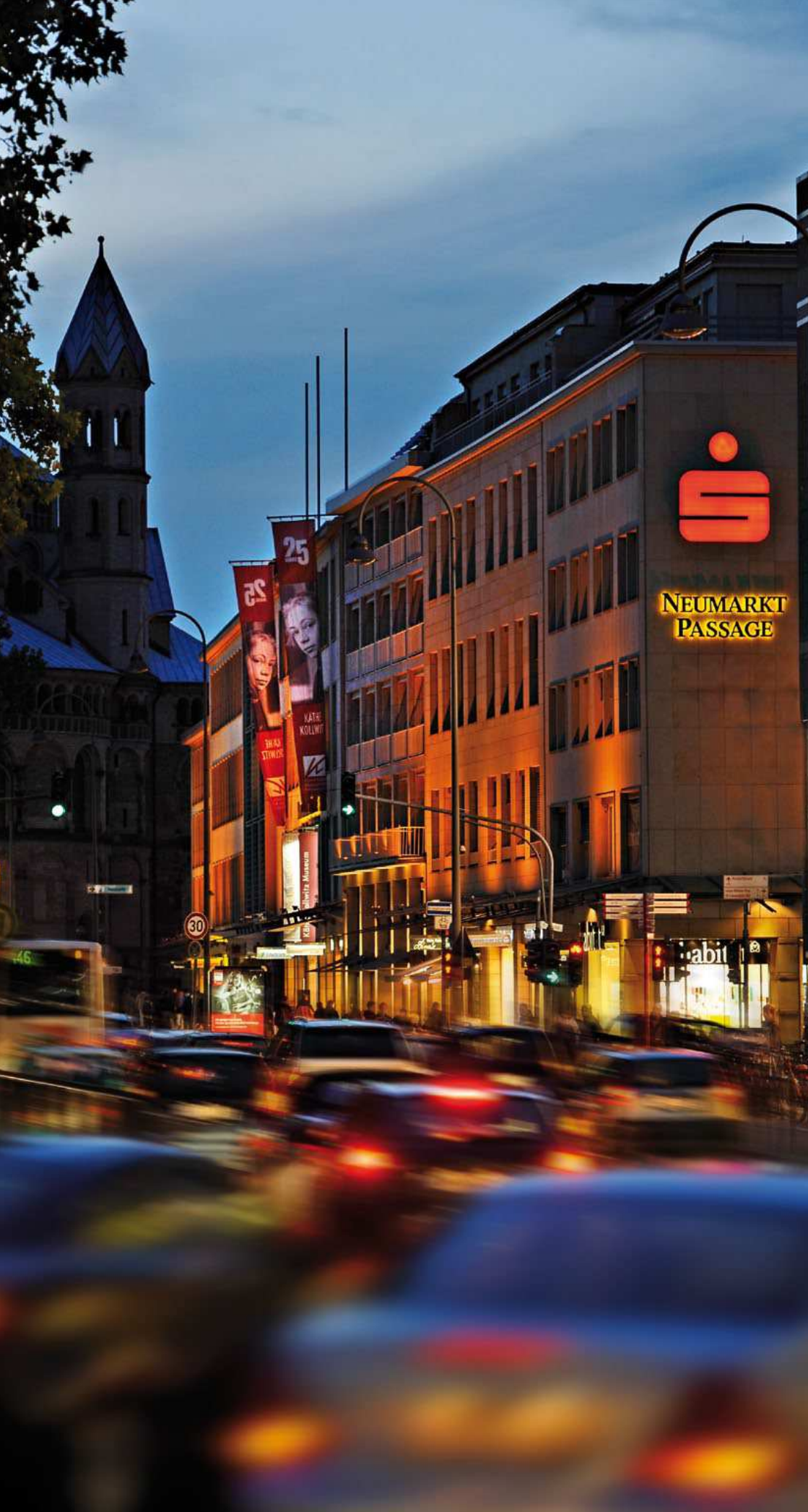
Blick auf die romanische Basilika St. Aposteln, die Kreissparkasse Köln und die Neumarkt Passage mit den Fahnen des Kollwitz Museums am Neumarkt in Köln