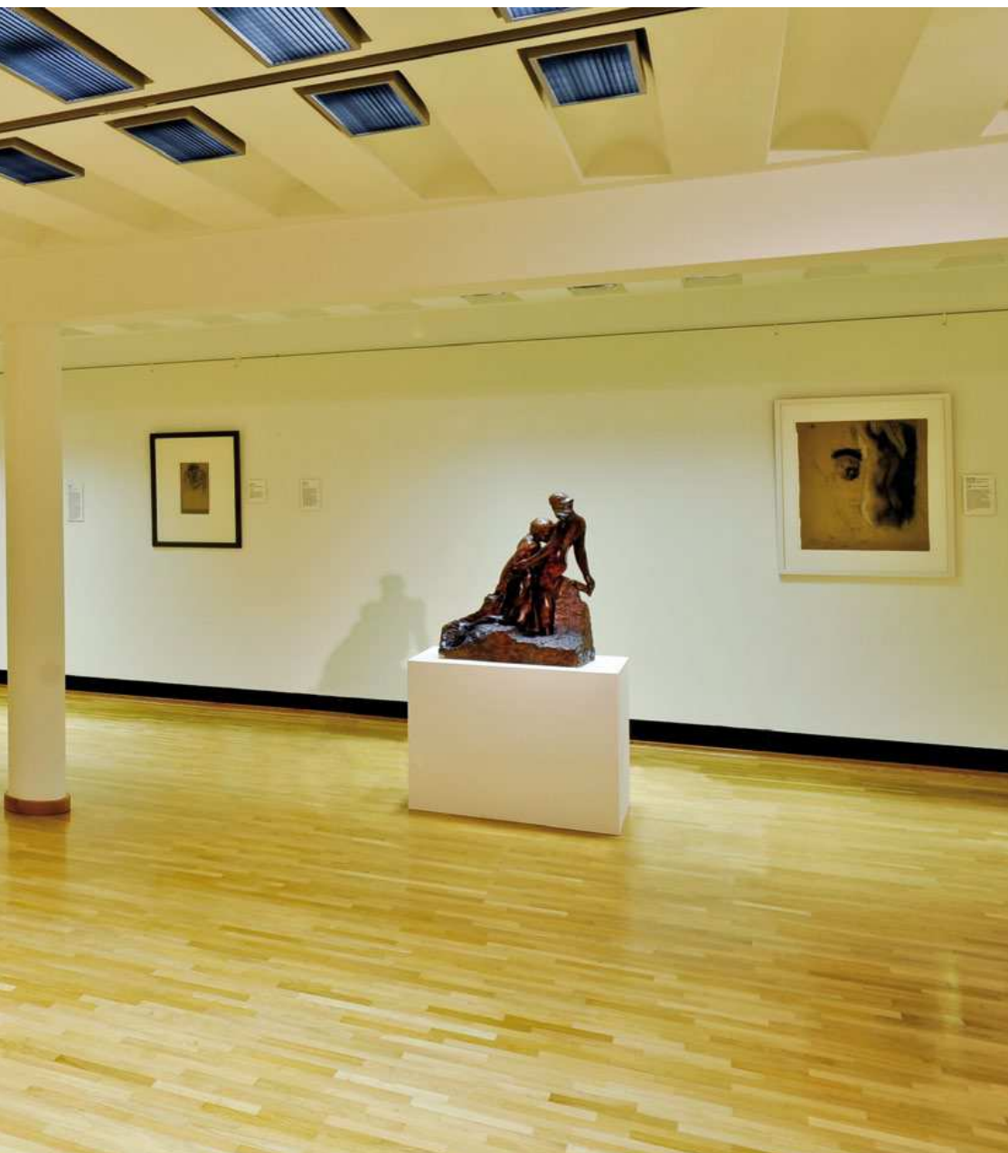
Links: Graphik und Plastik im Wechselspiel – Blick in die Jubiläumsausstellung im Untergeschoss