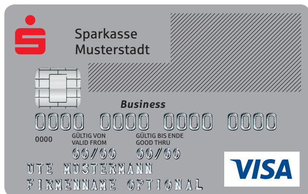
Variante Visa nur bei Prozessor PLUSCARD

Darstellung des Firmenlogos auf der Karte am Beispiel ausgewählter Kreditkartenprodukte mit dem Logo der DSV Gruppe: