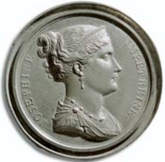
Einseitige Medaille um 1805 auf Napoleons erste Frau, Josephine de Beauharnais (*1763, † 1814) Napoleon heiratete 1796 die Witwe Josephine, sie wurde 1804 zur Kaiserin gekrönt. Er ließ 1809 die Ehe wegen Kinderlosigkeit annullieren und heiratete Marie Louise von Österreich.