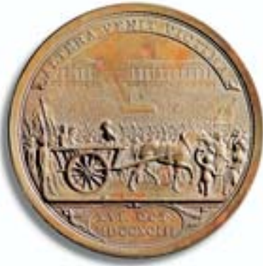
Französische Revolution, 1789-1799 Hinrichtung der Königin Marie Antoinette Medaille 1793 Die Königin wird im Leiterwagen zum Schafott gefahren.