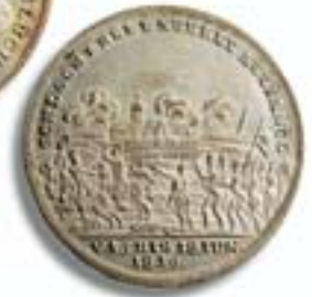
Medaille 1815 auf die Niederlage Napoleons in der Schlacht bei Waterloo Vs.: Blücher und Wellington, Rs.: Schlacht bei La Belle Alliance d.18. Juni 1815.