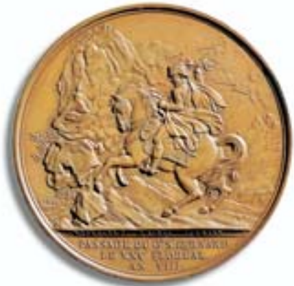
Übergang über den Großen St. Bernhard im Angriff auf Nord-Italien und die Schlacht von Marengo Medaille von Montagny, 1800 Rs.: Napoleon vor dem St. Bernhard. Ø 58 mm.