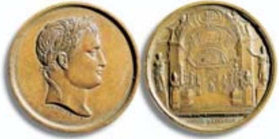
Eröffnung des Apollosaals im Louvre Medaille 1804.

schem Boden für seinen jüngsten Bruder Jérôme (Hieronymus) gründete. Diesem hatte er auch die erste Frau, eine Amerikanerin, ausgeredet, um ihn dann in seine dynastischen Pläne einzubinden. Hierfür fand sich eine württembergische Prinzessin, die mit ihm in Kassel als Königin residierte. Seine Sorglosigkeit und Verschwendung brachte Hieronymus den Namen „König Lustig“ ein – ihm blieb es vorbehalten, über alle späteren Krisen