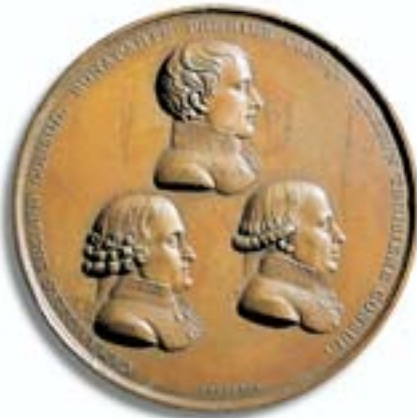
Bekanntmachung des Friedens von Amiens, 1802 Die Köpfe der drei Konsuln: Bonaparte, Cambaceres, Lebrun. Eine der wenigen Medaillen mit den Portraits aller drei Konsuln. Ø 68 mm.

Innenpolitische Veränderungen sind meist nicht so publikumswirksam wie außenpolitische Erfolge. Das hieß für Napoleon, erneut das Schlachtfeld zu suchen. Wieder griff er in Norditalien an, nachdem er den St. Bernhard überschritten hatte, wieder wichen die Österreicher zurück. Der Sieger konnte vorteilhafte Friedensschlüsse erreichen, seine Popularität wuchs weiter, so dass er es 1801 wagte, sich einer Wahl zu stellen, die ihm das Konsulat auf Lebenszeit bringen sollte. Auch diesbezüglich erfüllten sich seine Pläne und Wünsche.