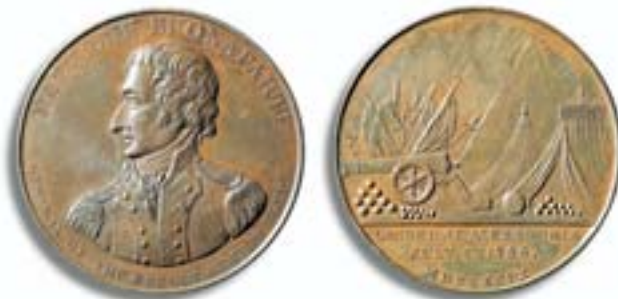
Englische Medaille 1799 auf die Landung Napoleons in Ägypten im Juli 1798

Die überlegene Armee machte auf ihrer Seefahrt erst gar kein langes Federlesen mit dem geistlichen Staat der Malteser-Ritter. Säkularisation gehörte zu den er-