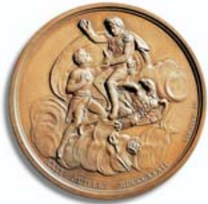
Tod des „Herzog von Reichstadt“ genannten Sohnes von Napoleon Medaille 1832, von Bauchery .

Vs.: Totenmaske Napoleons, Rs.: Napoleon sitzt in Wolken auf einem Adler und zieht seinen Sohn an sich.