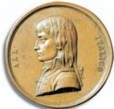
Revolution, 1789-1799 Medaille 1797 auf die Befreiung der Lombardei.

Als Ergebnis der Siege Napoleons verzichtete der habsburgische Kaiser Franz II., selbst in seinen Kernländern angegriffen, im Frieden von Campo Formio auf die Lombardei und das linke Rheinufer. Damit gehörte auch das bereits 1794 durch französische Revolutions-