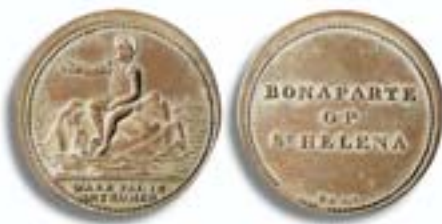
Napoleon auf St. Helena. „Wie soll ich hier wegkommen?“ Niederländische Spottmedaille 1815.

Asyl. Am 14. Juli 1815 verlässt er für immer Frankreich. Doch nur wirkliche und blaublütige Souveräne können auf ein Asyl im „Verwandtenkreis“ an einem europäischen Fürstenhof hoffen. Ein englisches Schiff bringt Napoleon mit 50 Getreuen in zwei Monaten Schiffsfahrt auf die entlegene Atlantikinsel St. Helena, 3.000 km von Brasilien und 2.000 km von Afrika entfernt, wo ihm unter ständiger Überwachung ein nochmaliges Entkommen wie von Elba oder seinerzeit aus Ägypten unmöglich ist. Empfangen wird er dort nicht mehr als Kaiser – die Engländer haben ihn nie als solchen anerkannt – sondern als „Staatsgefangener General Buonaparte“.