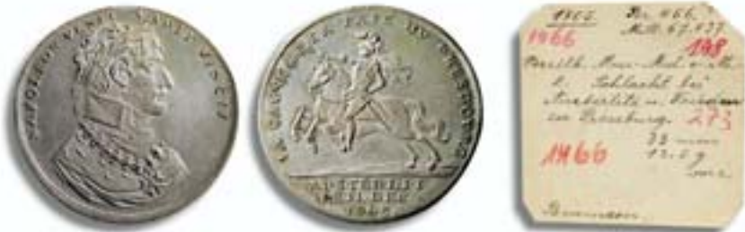
Volksmedaille 1805 aus versilbertem Messing auf den Frieden von Pressburg nach der Schlacht von Austerlitz.

Der Kaiser der Franzosen schritt von Sieg zu Sieg, und in den anschließenden Friedensschlüssen veränderte er das Gesicht Europas. Seine Feinde waren nicht einig und konnten deshalb nacheinander besiegt werden. Alte Rivalitäten der Gegner wusste er geschickt zu nutzen. Als unbeugsamer Hauptgegner und treibende Kraft der Kriege seit 1798 erschien ihm England, das 1805 wieder eine Koalition gegen Frankreich zustande gebracht hatte. Zuerst wandte sich Napoleon gegen Österreich, die Koalitionsmacht, die er schon kannte. Er rückte entlang der Donau vor, bis er vor Wien stand. Ein Abstecher nach Böhmen sah ihn als den Sieger von Austerlitz, wo er die Drei-Kaiser-Schlacht für sich entschied, Russen und Österreicher besiegte und danach im Frieden von Pressburg dem Kaiser Franz I. von Österreich Tirol und die letzten österreichischen Besitzungen in Italien abnahm. Der Koalitionspartner Preußen, der 1805 abseits gestanden hatte, wurde im nächsten Jahr vorgeknöpft, dann war auch er unterworfen: Jena und