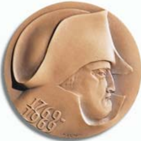
Medaille 1969 von Karel Zeman zum 200. Geburtstag Napoleons Modern und interessant gestaltete Medaille des tschechischen Künstlers.

„Er ist von seinem Glück so geblendet und meint, alles zu vermögen. Dabei ist er ohne Mäßigung, und wer nicht Maß halten kann, verliert das Gleichgewicht und fällt.“