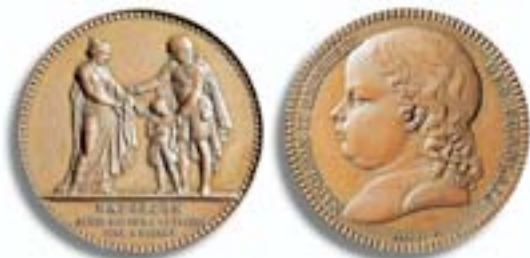
Medaille 1815, zweite Abdankung Napoleons und Einsetzung seines Sohnes als Napoleon II. Vs.: Napoleon übergibt seinen Sohn an Frankreich. Der Vierjährige auf dem Kaiserthron wurde von den Siegern über Napoleon nicht ernst genommen. Sie setzten Ludwig XVIII. wieder ein.

Napoleon zog sich mit den Resten seiner geschlagenen Truppen nach Paris zurück, um dort am 22. Juni 1815 zum zweiten und letzten Mal mit verwaschenem Namenszug seine Abdankung zu unterschreiben. Er setzt noch sein vierjähriges Söhnchen als Nachfolger ein, aber niemand nimmt dies ernst. Unter dem großmütigen und mäßigenden Bourbonenkönig Louis XVIII. wird die Monarchie wieder hergestellt, die erst 23 Jahre zuvor durch die Revolution gestürzt worden war.