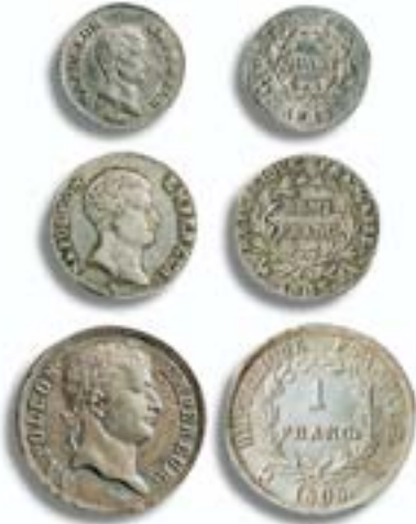
Napoleon als Kaiser, 1804-1814 und 1815 Münzen zu 1/4 und 1/2 Franc An 13 (22. 9. 1804 bis 21. 9. 1805), und 1 Franc 1808, Mzst. Paris (A) 1805 bis 1808 regierte der Kaiser Napoleon die „République Française“.

Erst ab 1809 wird die Landesbezeichnung auf Münzen „Empire Français“ geschrieben.