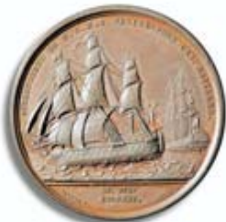
Einschiffung Napoleons nach Sankt Helena als Kriegsgefangener auf der englischen „Bellerophon“ Medaille 1815.

Niemand will den abgedankten Kaiser haben. Er schreibt schließlich einen Brief und bittet ausgerechnet in England um