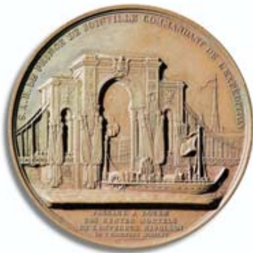
Überführung der Gebeine Napoleons nach Paris

Medaille 1840, von Depaulis. Vs.: Totenmaske, Rs.: Schiff unter der Brücke von Rouen.