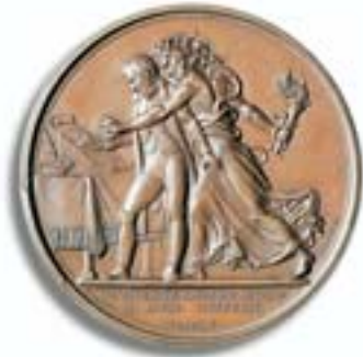
Die erste Abdankung, 1814, vor der Deputation nach Elba Medaille 1814.

herauszukommen. Seine Gegner zeigten sich großzügig, sie beließen ihm den Kaisertitel. Nach einer Friedenskonferenz erfolgte dann jedoch im Mai 1814 die Verbannung auf die kleine Mittelmeerinsel Elba, wo er sich als Landesfürst mit 700 Freiwilligen der alten Garde um die Angelegenheiten seines Kleinstaates kümmerte, stets in Verbindung zu seinen Angehörigen und Anhängern, die nur auf seine Wiederkehr hofften. Der Verlauf des Wiener Kongresses unter Fürst Metternich und die erneute Spaltung Europas in Interessengruppen veranlassten Napoleon im Februar 1815 zur Flucht über See, und tatsächlich gelang ihm wieder eine