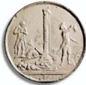
Volksmedaille 1793 auf die Hinrichtung Ludwigs XVI. durch die aus humanitären Gründen neu entwickelte Guillotine Solche oft in Zinn gegossenen Medaillen wurden als Erinnerung billig an das Volk verkauft.

Die Wirren der Revolution drangen auch bis in die Armee vor, wo Parteinahme gefordert war, nicht zuletzt in innenpolitischen Machtkämpfen. Welcher junge Mann wollte da nicht bei den Revolutionären sein? Die Brüder Joseph und Luciano (Lucien) ganz entschieden, sie zogen als Kommissare mit revolutionären Parolen durchs Land. Von dem Artilleristen, der sich ebenfalls als eisernen Republikaner bezeichnete und der 1792 Zeuge des Sturzes der Monarchie wurde, sprach keiner, bis er durch einen Zufall und ent-