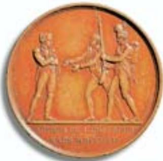
Marsch Napoleons auf Paris, Medaille 1815 Die inzwischen unter Ludwig XVIII. königlich gewordenen Truppen laufen zu Napoleon über.

herauszukommen. Seine Gegner zeigten sich großzügig, sie beließen ihm den Kaisertitel. Nach einer Friedenskonferenz erfolgte dann jedoch im Mai 1814 die Verbannung auf die kleine Mittelmeerinsel Elba, wo er sich als Landesfürst mit 700 Freiwilligen der alten Garde um die Angelegenheiten seines Kleinstaates kümmerte, stets in Verbindung zu seinen Angehörigen und Anhängern, die nur auf seine Wiederkehr hofften. Der Verlauf des Wiener Kongresses unter Fürst Metternich und die erneute Spaltung Europas in Interessengruppen veranlassten Napoleon im Februar 1815 zur Flucht über See, und tatsächlich gelang ihm wieder eine