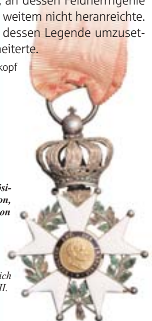
Orden der französischen Ehrenlegion, 1802 von Napoleon gestiftet.

Dieses Kommandeurskreuz wurde im Zweiten Kaiserreich unter Napoleon III. (1852-1870) ausgegeben.