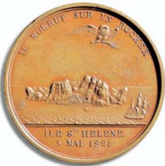
Medaille 1821 auf Napoleons Tod auf St. Helena

weit wie möglich – strahlt doch sein Ruhm auf sie zurück. Nur sein zweitältester Bruder Luciano hat sich dem Papst unterstellt. Besuchserlaubnis auf der einsamen Insel wird jedoch niemandem gewährt.