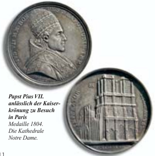
Papst Pius VII. anlässlich der Kaiser- krönung zu Besuch in Paris Medaille 1804. Die Kathedrale Notre Dame.