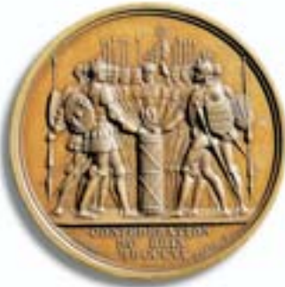
Medaille 1806 auf die Gründung des Rheinbundes 14 deutsche Fürsten schwören über einem Rutenbündel.

Auerstedt markieren die Siege Napoleons auf dem Weg nach Berlin, wo er 1806 eintraf und die Kontinentalsperre gegen England verkündete. Indem er dessen Handel vernichtete, hoffte er den Gegner zu treffen, der ihm keine Feldschlacht bot. Der geflohene preußische König hätte zu gerne den Zaren zum Eingreifen bewogen, doch der schloss nach einer Niederlage sogar ein Bündnis mit Napoleon, der nun unangefochten Preußen im Frieden von Tilsit plündern konnte: Preußen verlor seine Gebiete westlich der Elbe, die dem Königreich Westfalen zugeschlagen wurden. Das Königreich Westfalen war der zweite Satellitenstaat, den Napoleon als Protektor des Rheinbundes auf deut-